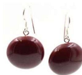
Boucles d'oreilles 'SOLEIL' Réf : BO.S 10 €