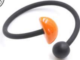
Bracelet 'INCA' PVC Réf : B.I.PVC 12 €