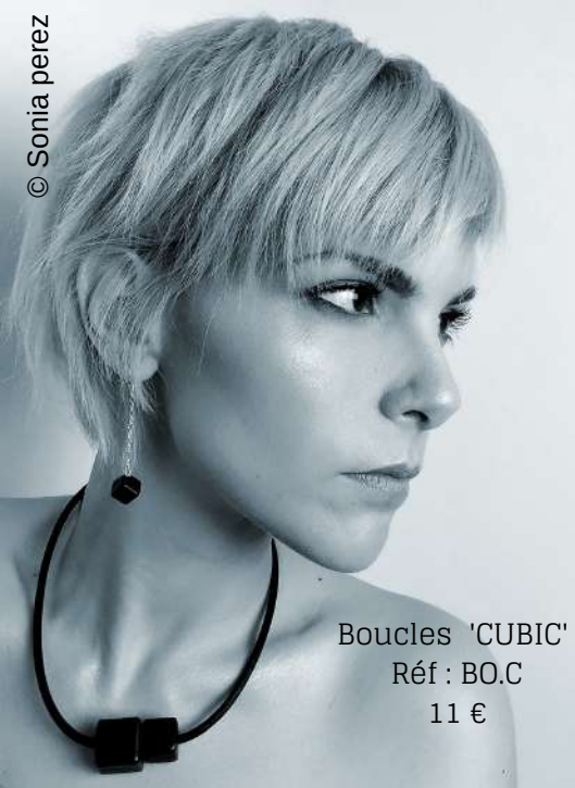
Boucles 'CUBIC' Réf : B.O.C 11 €