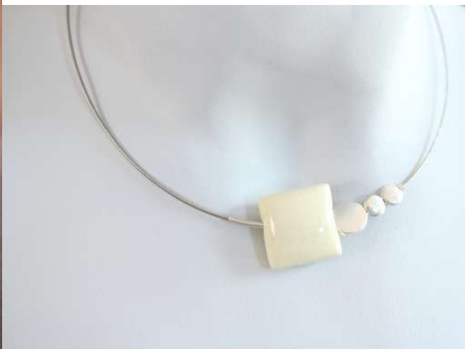
Collier 'MOZAÏC' Réf : CMO 19 €