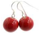
Boucles d'oreilles 'PERLES' Réf : BO.P 10 €