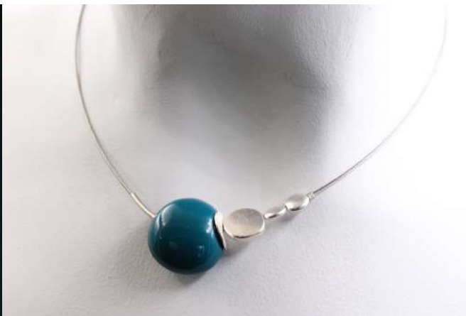
Collier 'ÉCHO' Réf : CECH 19 €