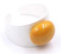
Bague 'COFFEE' Réf : BC 10 €