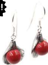
Boucles d'oreilles 'FLEUR' Réf : BO.F 11 €