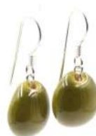
Boucles d'oreilles 'GOUTTE D'EAU' Réf : BO.GO 10 €