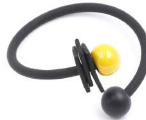
Bracelet 'TRIBAL' Réf : B.T 12 €