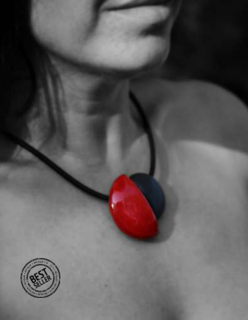
Collier 'INCA' Réf : CI 17 €