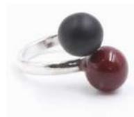
Bague 'DUO' Réf : BD 10 €