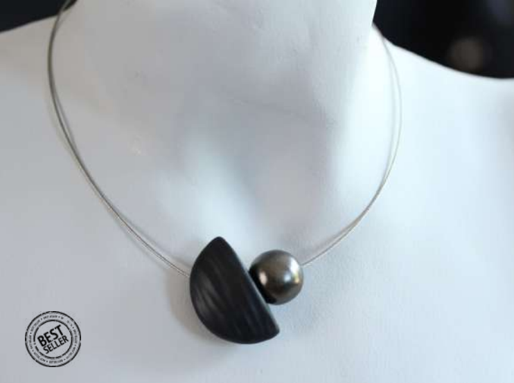
COLLIER 'NAÏS' Réf : CNA 15 €