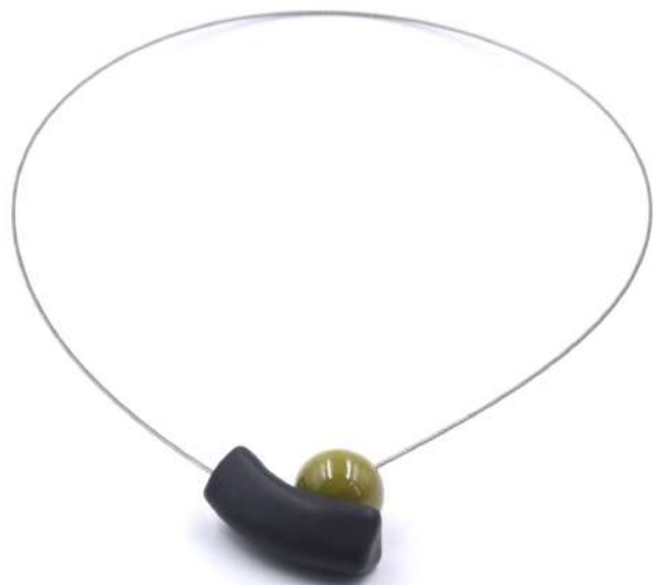
COLLIER 'ATOME' Réf : CA 19 €