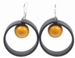
Boucles d'oreilles 'TEMPO' Réf : BO.TE 11 €