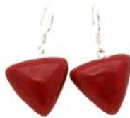
Boucles d'oreilles 'BERLINGOTS' Réf : BO.B 10 €