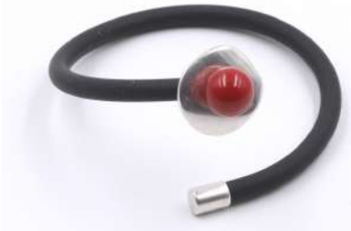
Bracelet 'FLEUR' PVC Réf : B.F.PVC 12 €