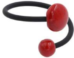
Bracelet 'SOLEIL' PVC Réf : B.S.PVC 12 €