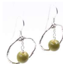
Boucles d'oreilles 'GYPSIES' Réf : BO.G 11 €